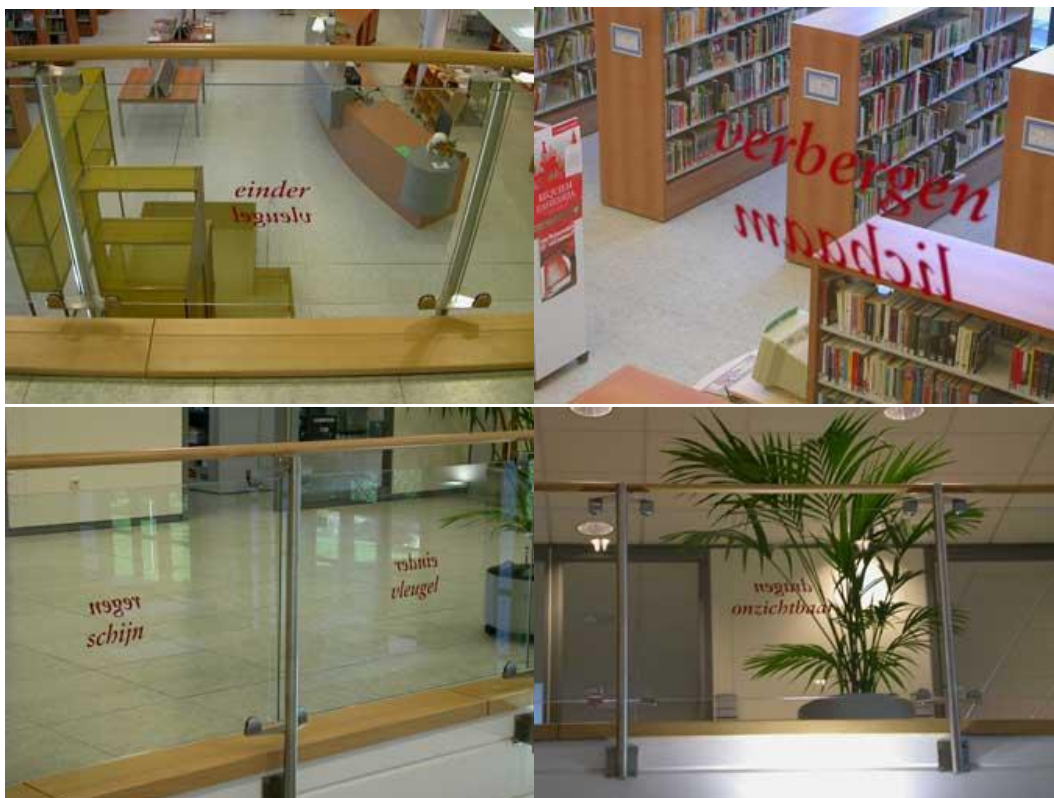
Installatie 'Embracing Words', Geert Vermeire bibliotheek Zwijndrecht 2005

Deze dualiteit benadrukt het belang van de culturele functie van de bibliotheek. Terwijl bibliotheken tot nu toe vaak hun taken en leesbevordering discoursief zagen is er de dringende nood aan een figuratieve invulling. Meer figuratieve sensibilliteit betekent: 'Wat doet een boek met je?'. Het is het uitnodigen van de beleving, van de verbeelding als proces in de bibliotheek. Dat is nu eenmaal waar het in lezen om draait. Literatuur (en ook bibliotheken) bestaan bij gratie van verlangen en emoties. Een figuratieve sensibilliteit is een niet-statische manier om de culturele functie van bibliotheken in te vullen. Cultuur is niet statisch, is voortdurend in verandering. Het individu wil het gevoel hebben hierin een rol te kunnen spelen