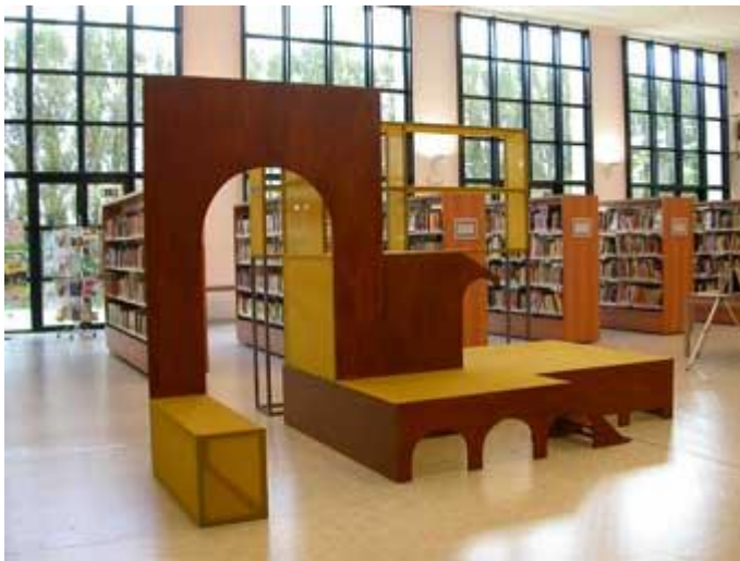
Installatie 'Skin', Stefaan van Biesen, bibliotheek Zwijndrecht 2005

Dit schreeuwt om een tegenbeweging, die de openbare bibliotheken kunnen geven.